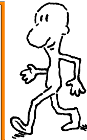
Peserta KB Pria